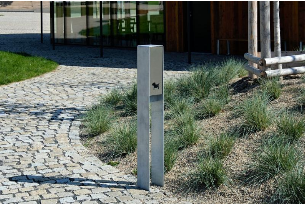
Design mobiliáře je chráněn autorským zákonem

Popis Držák sáčků na psí exkrementy, navržen na papírové sáčky. Otvory pro kotvení do podkladu.